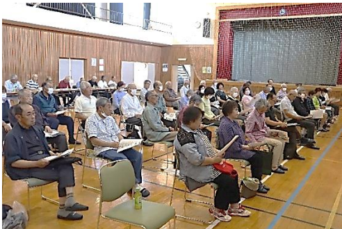
郷土の偉人の講義を真剣に聴講する受講生の皆さん

多くのオランダ語の翻訳本を出しました。農業、化学、天文学、栄養学、医学、砲術から万有引力や太陽の自転の説明まで多岐にわたり、その博学ぶりは目を見張るものがあります。有名な「夢物語」は海外の情勢をもとに幕府の対外政策を批判したとされ投獄されました。92点にも及ぶ著書、翻訳書は日本の近代化に大いに役立ち、明治31年に罪人として扱われてきた長英は自由民権運動の先駆者として見直され、宮内省より「正四位」が追贈され名誉が回復しました。