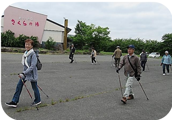
正しいフォームで颯爽とコースへ