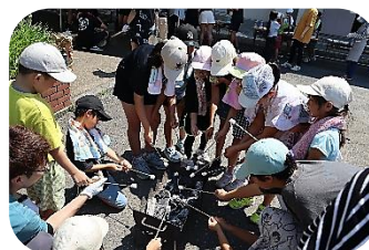
昨年の寺子屋の様子