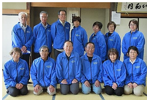
「ドジャースブルー」が佐倉河地区の民生児童委員・主任児童委員の目印です