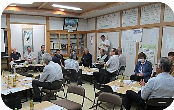
質問が絶えない活発な研修になりました