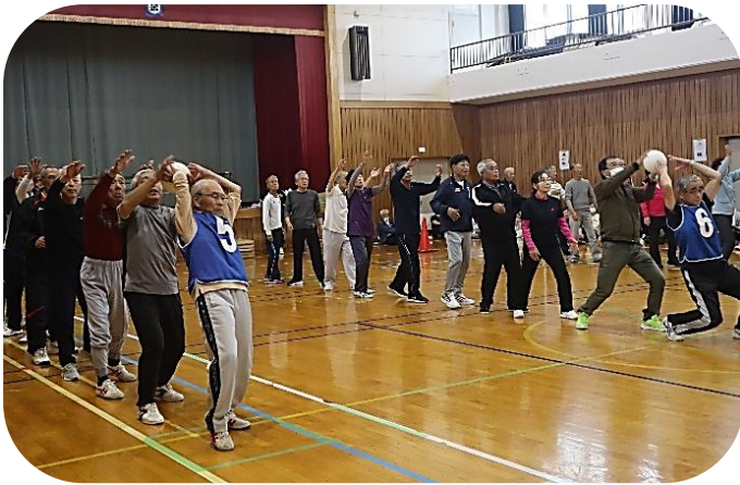
ボール送りリレーの様子

6月23日水沢体育館で開催される「第5回水沢シニアスポーツ交流大会」に出場するチームの活躍を期待しています。