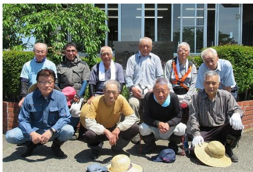
6月17日館長協議会の皆さんに、地区センターの植木の剪定と草刈りをいただきました