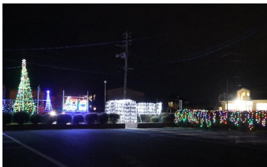
昨年よりパワーアップしたイルミネーション点灯

昨年より飾りつけが多くより華やかなイルミネーションが点灯されました。キッチンカー等出店もあり、来場された方は飲食も楽しんでいました。