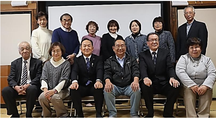
新たなメンバーで、皆さんのお力になる民生児童委員・主任児童委員さんです。よろしくお願いします

民生児童委員は、地域の身近な相談役として、3年の任期で担当地域ごとに委嘱され、住民の生活上の相談や援助、国や市からの依頼による市民生活に関する実態調査や福祉関係団体との調整などの業務に当たります。今回退任された委員の皆さん長い間ご苦勞様でした。