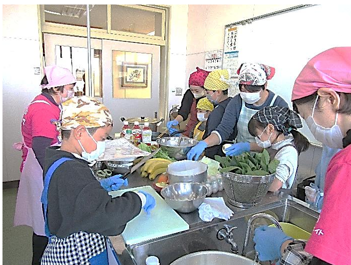
お料理作りがとっても楽しかったです