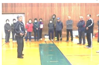
最初はゲームの進め方の説明

初めて参加される方、昨年に引き続きの参加者も「どんどんゲーム」にハマっていく。とにかく楽しかった」との感想が多く聞こえました。