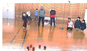
子ども達と白熱した試合を展開