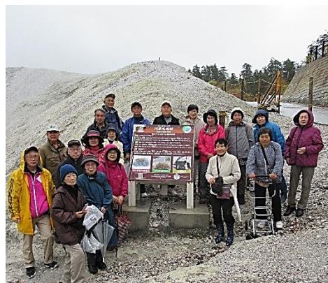
ウォーキング前に記念撮影 📷

10月26日総合型佐倉河スポーツクラブ主催、佐倉河地区振興会共催で、今年度2回目の「ものしり発見ウォーキング」を開催しました。 今回は秋田の湯沢方面で紅葉を楽しむ予定でしたが、あいにくの雨模様のため、日本三大霊地の一つ「川原毛地獄」でのウォーキングとなりました。 草木が生えない灰色の山肌が現れ、斜面は荒涼とした不気味な光景の中を雨のため小走り気味でウォーキング。他にも「小安峡」「小町園」と巡り、最後の見学地「稲庭城」は、当日の朝の熊の出没による臨時休業のため見学できませんでした。参加者の皆さんからは「雨降りに熊騒動。思い出に残る日になった」との感想でした。