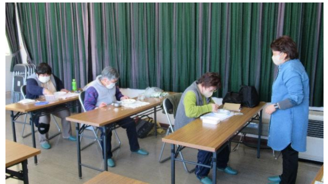
細やかな作業でしたが間もなく完成です

を取り丁寧に進めていきました。ポーセラーツはマグカップやコーヒーカーップ、大皿等も作成可能です。 最後は講師に一人一人作品を見ていただき、補正して完成となりました。 作品は講師の窯で焼いて、後日参加者に渡される予定です。