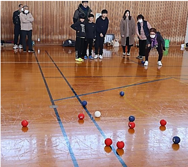
これはいいコースに行ったネ〜