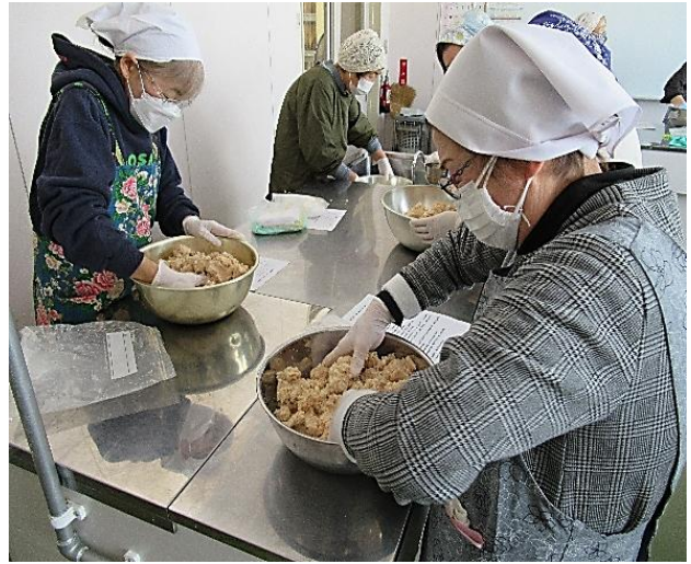
大豆・麴・塩を混ぜ合わせる参加者の皆さん

2月19日佐倉河地区センターで、10名の参加者のもと、味噌づくり体験を行いました。