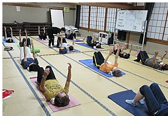
股関節の歪みを自分でチェック

方の癖を根本的に改善しましょう！」と話があり、1回ごとに首や肩回り、腰回りなどポイントを絞って、さする・押し動かす・脱力・ちいさな揺らぎ等の動作を行いました。 帰り際に参加者から、「体が楽になった」「体が軽くなった」などと効果を実感する声が多く聞かれました。