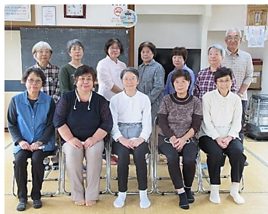
柝の木よさってクラブの皆さん

「一人でやるよりいい」「休むと体力が落ちる」と話す参加者の方々から、みんなで取り組む良さが伝わってきました。