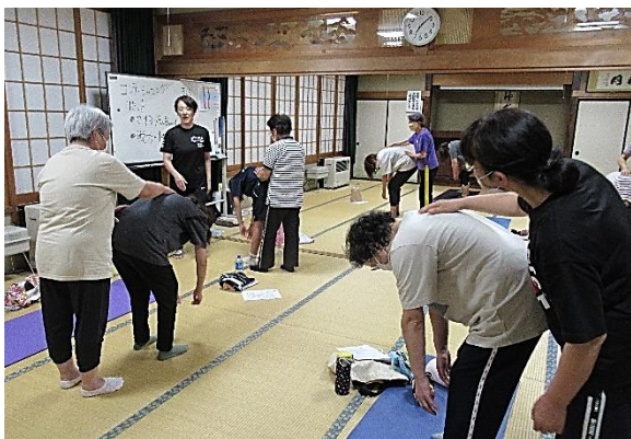
参加者同士で「さする」の実践

開口一番、講師より「コンディショニングは筋肉を整えて身体をいい状態にすること。歪みや痛み、身体の不調には必ず原因があるので、自分の姿勢や筋肉の使い