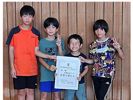
優勝した松堂KSSチーム