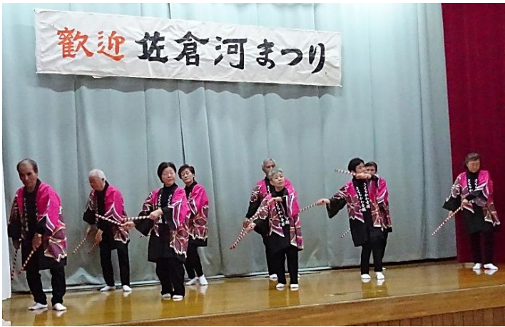
昨年の第三部演芸発表の様子

地区民のお祭り「佐倉河まつり」を 11 月 3 日（日・文化の日）に開催します。 芸術・スポーツ・演芸など見るだけでなく参加して、皆さんでお祭りを盛り上げましょう。 ご来場をお待ちしています。 【発表部門】 第一部 子ども芸能 第二部 児童クラブ一輪車演技 第三部 芸能発表