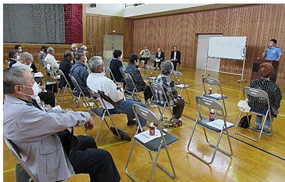
真剣に聴講する受講生の皆さん

初めに詐欺の説明では、昨今「投資」「結婚」「国際電話」による特殊詐欺が急増しており、儲け話等には充分注意が必要とのことでした。また、