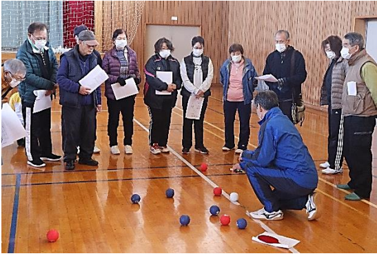
これは白いボール（ジャックボール）に近い赤の勝利

総合型佐倉河スポーツクラブ主催、佐倉河地区振興会共催で多世代交流会「ボッチャ」を開催しました。ボッチャでの交流会は、今年で2回目ですが、初めて参加した人が多かったため、ルール等のポイントを十分に説明してからゲーム開始となりました。参加者20人が、3人一組のチーム編成を行い、リーグ戦で奥の深いゲーム展開となりました。終始歓喜の声が体育館に響き渡り、白熱した状況が感じられ、参加した方からは「とっても楽しかった」との声が多く、地区の交流も兼ねた有意義な交流会となりました。