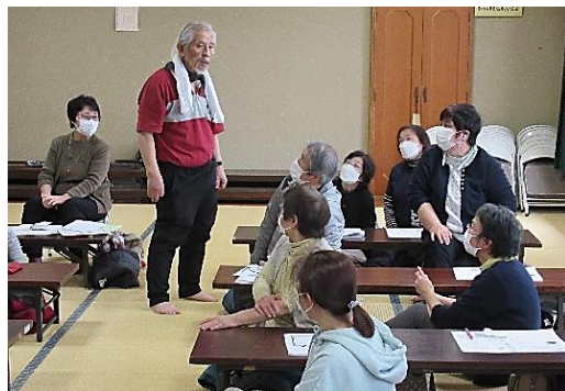
自分の体に良いことをどれだけやるかが大事！

病気にならない体を作るには、自分の体に良いことをどれだけやるかが大事。①塩分・砂糖をとり過ぎると手の第一関節が曲がってくるので食事に気をつける。薬膳料理の話も紹介②肩が痛い時にタオル一本で直す方法等、貴重な講演となりました。講師からは、「地区で耕作放棄地あったら薬草、薬木を植えてみなさい」というアドバイスもあり、参加者の皆さんからもう一度聞きたいとの声