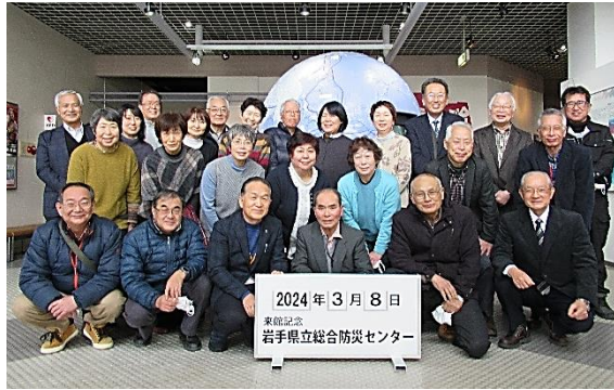
研修後、参加者全員で記念撮影

3月8日水沢地域福祉推進協議会佐倉河支部の役員・代議員25名は、県立総合防災センターで防災についての研修を行いました。煙体験では、想像以上に視界が悪く方向感覚が狂うことを体験。また、地震体験では、揺れで家具が動いたりコンロから鍋が落ちるのを実体験し、「家が壊れそう」「やけどをしないように無理にコンロの火を止めに行かない方がいいね」など、場面に応じていかに正しく行動するかを一人一人が考えるきっかけとなる研修でした。