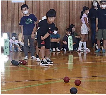
ジャッジボールを目掛けてボールを投げる表情は真剣そのもの

ボッチャは、障がいの有無に関係なく誰でも楽しめるスポーツで、パラリンピックの正式競技。白いジャッジボールをチームごとに投げ、ジャッジボールに近いボールの数で点数が入り、勝敗が決ま