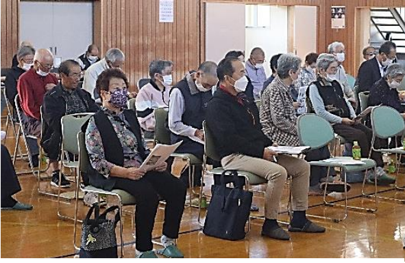
地元の歴史に関心が高く、熱心な質問も出されました

佐倉河の前半入遺跡から5世紀後半のものと思われる須恵器（米食用の食器）、黒曜石製石器（動物の皮をはぐために使う）が出土し、この時期、半農半猟の生活をしていたのではないかと考えられているそうです。