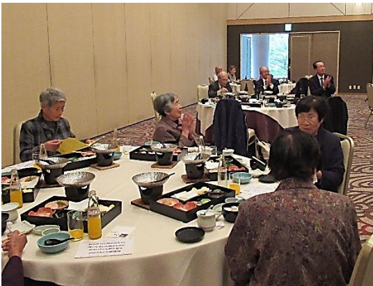
会食しながら楽しい時間を過ごしました