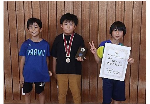
優勝した松堂 A チーム

子どもたちからは「初めてだったけれど楽しかった」「簡単そうで難しかった」「来年はもっと頑張りたい」などの声が聞かれ、とても楽しい交流大会になりました。