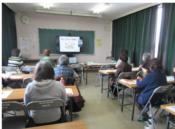
地区センターで初めてオンライン講座開催

ロールが高い方が良い)。加齢に伴い筋力が弱ると口の周りの筋肉や舌の動きが悪くなるので誤嚥になりやすいため、食事前に「ぼたから体操」が有効。「ぼ」25回「た」25回「か」24回「ばたか」8回各5秒間で行う。 今回は、オンラインで行われましたが、受講者の皆さんからは、「すごく良かった」「分かりやすかった」「楽しかった」「これからの食生活に役立てたい」など大好評でした。