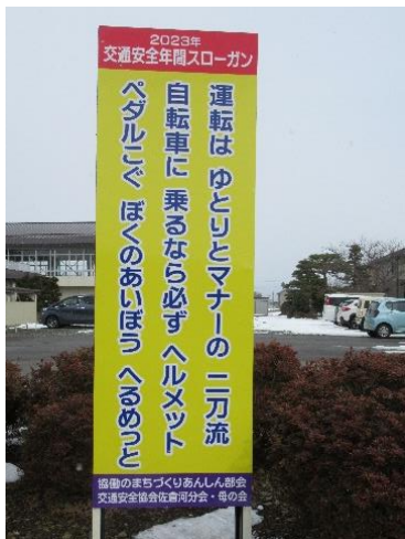
全国統一の令和5年度交通安全スローガン看板