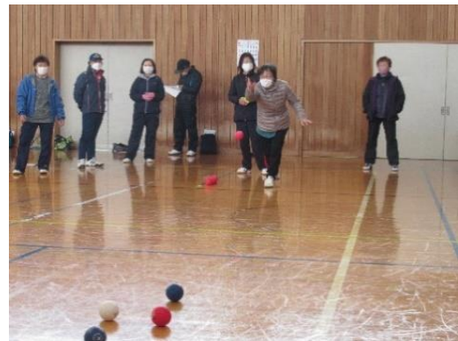
ボールいい所に行ったヨ～