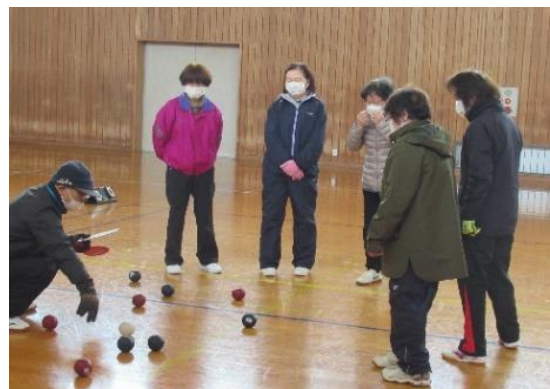
ジャックボールに近い青が 2 点です

2月18日総合型佐倉河スポーツクラブ主催、佐倉河地区振興会共催で多世代交流会「ボッチャ」初開催しました。