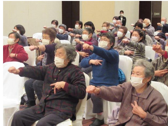
イスに座りながらの体操と脳トレゲームに挑戦です

煌びやかな衣装を早着替えしながらの懐かしい歌や華やかな踊りの数々に、参加者は暫し時間を忘れて楽しんでいました。 参加者の「とても楽しい時間だった」との声と笑顔が充実した時間だったことを物語っていました。