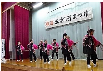
「佐倉河音頭(板付き)」を披露