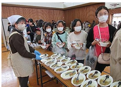
こども・地域食堂