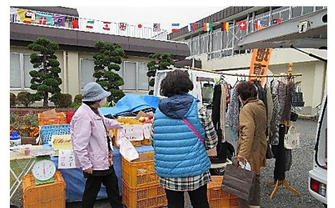
大盛況の軽トラック市