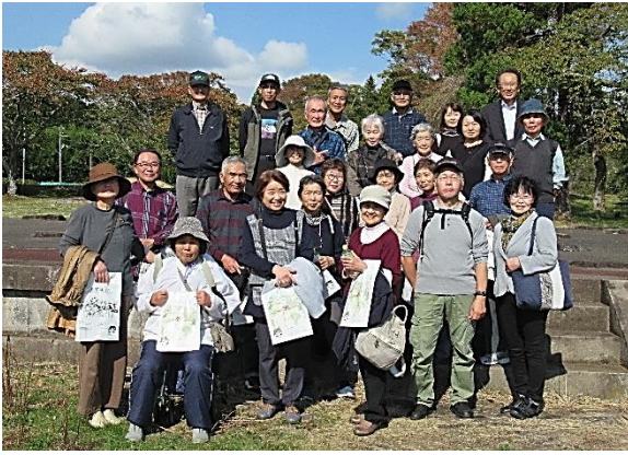
多賀城跡で記念撮影

最初に特別史跡「多賀城跡」をボランティアガイドの案内で見学。多賀城は発掘調査が昭和36年から始まり、8世紀初めから11世紀まで存続していたことが分かっているそうです。次に重要文化財「多賀城碑」を見学しました。多賀