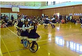
放課後児童クラブの一輪車演技