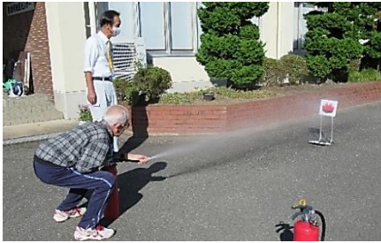
定期利用団体の佐公ラージの皆さんと消火訓練