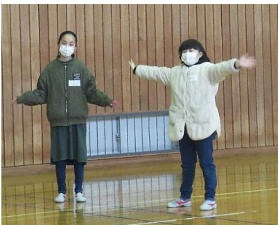
軽快なリズムに合わせて、ダンスを踊りました

当日は底冷えのする寒い日でしたが、講師の準備した様々なジャンルの音楽に合わせて身体を動かしました。程よい汗をかき、みんなと同じ動きをすることにより協同性や一体感が生まれたのではないのでしょうか。