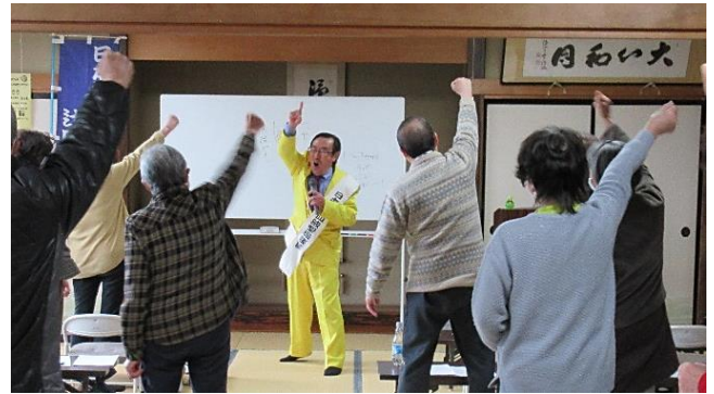
「エイエイオー」の掛け声でみんなの元気を引き出す

寝る（首は体の中で一番大事）。さらに、漫談・落語を聞いて笑う（ナチュラルキラー細胞が増える）。また、ボケ防止には草むしりかパソコン操作（指先を使う）等を行うことだそうです。