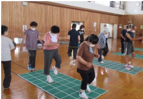
真剣にスクエアステップにチャレンジする皆さん

スクエアステップは、一辺25cmの正方形が横に4個縦に10個並んだマットを利用し、そのマットの上で足踏み（ステップ）を行う運動です。指導者の正しいステップのパターンを見て参加者が間違えないようにまねをして進むのですが、前に行ったパターンが頭から抜けきらず、思った通り動くのに苦戦していました。簡単な運動なのに