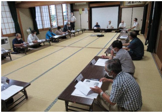
佐倉河地区自主防災組織等連絡協議会の会議の様子

災害はいつ起きるかわかりません。日頃から地域ごとに対応できるように準備しておく必要性を再確認する会議になりました。