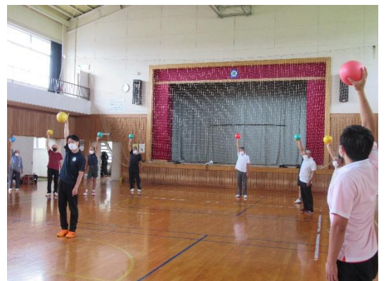
スモールボールをしっかりつかんで腕を上げましょう