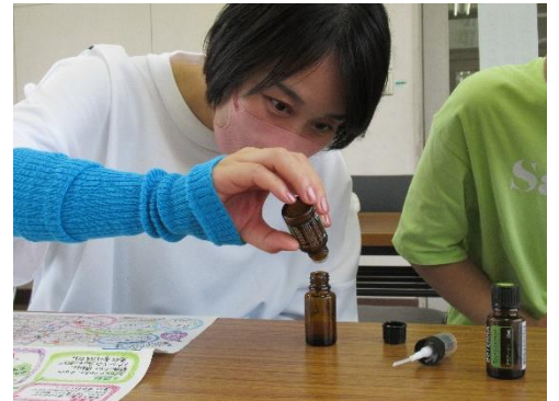
「テラアーマー」を5滴垂らして、スプレーを作成中

作り方は、小瓶にオイル10CCとテラアーマーを5滴垂らして良くかき混ぜ、精製水を小瓶の肩まで入れて良く混ぜる。このスプレーは1ヶ月は使用できるそうです。諸事情による日程変更で欠席者が多くなってしまいました。が、「たくさん質問もできて、とても楽しい時間でした」