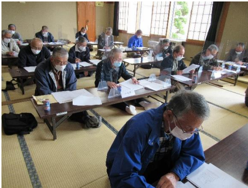
役員会の様子。役員会で令和4年度総会は書面議決になりました